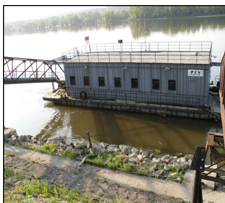
Radvaň n/Dunajom - Virt I. , ČS Radvaň – plávajúca čerpacia stanica